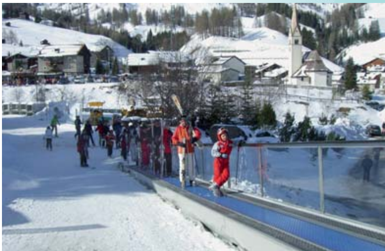
Förderband mit motorisiertem Handlauf – 1 200 000 transportierte Personen in der Wintersaison 2006/2007 (Arrabba – Italien).

Die Erfahrungen des Unternehmens bei Konzeption, Planung, Produktion, Montage und Wartung der Einstiegsförderbänder werden in der Entwicklung und dem Bau von Zubringerförderbändern umgesetzt. Compac liefert seine Bän-