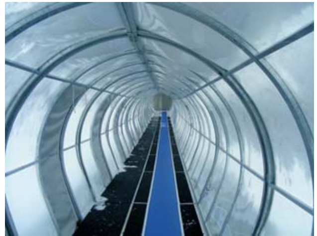
Neue Kuppel 2007.