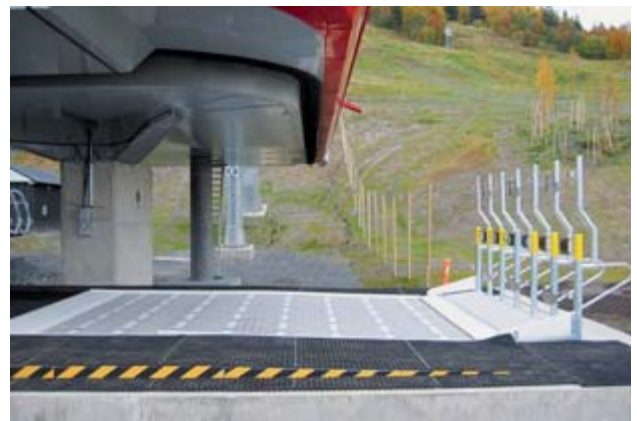
Automatisch hebbares Einstiegsförderband für eine 6er Sesselbahn (Are – Schweden).