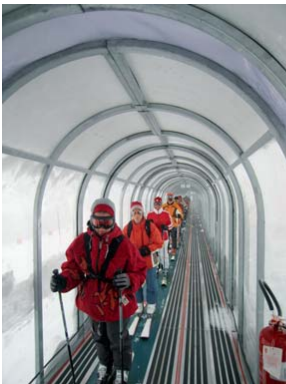
2 Förderbänder mit Kuppel (Arlberg – Österreich).