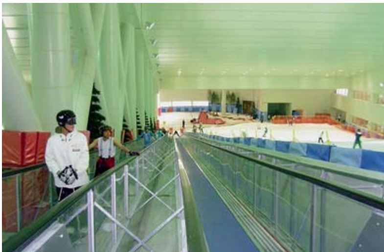
Förderband Skihalle Tiger-World (Korea).

Die innovative Compac GmbH aus Gossensass ist vorrangig im Bereich Förderbänder für Aufstiegsanlagen und Zubringerförderbänder tätig. Flexibilität, Schnelligkeit und Zuverlässigkeit prägen das Unternehmen.