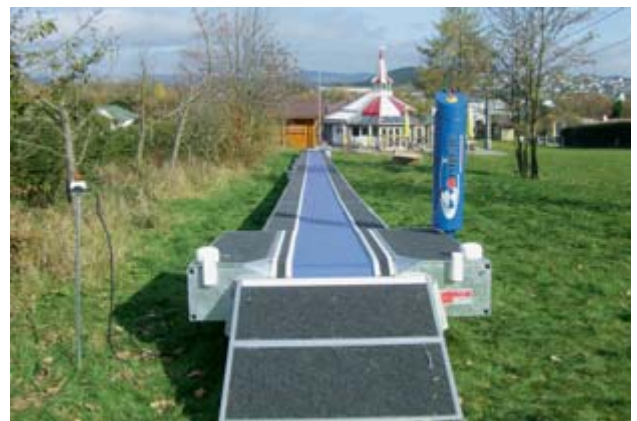
Neues Förderband 2007 – D-Winterberg.